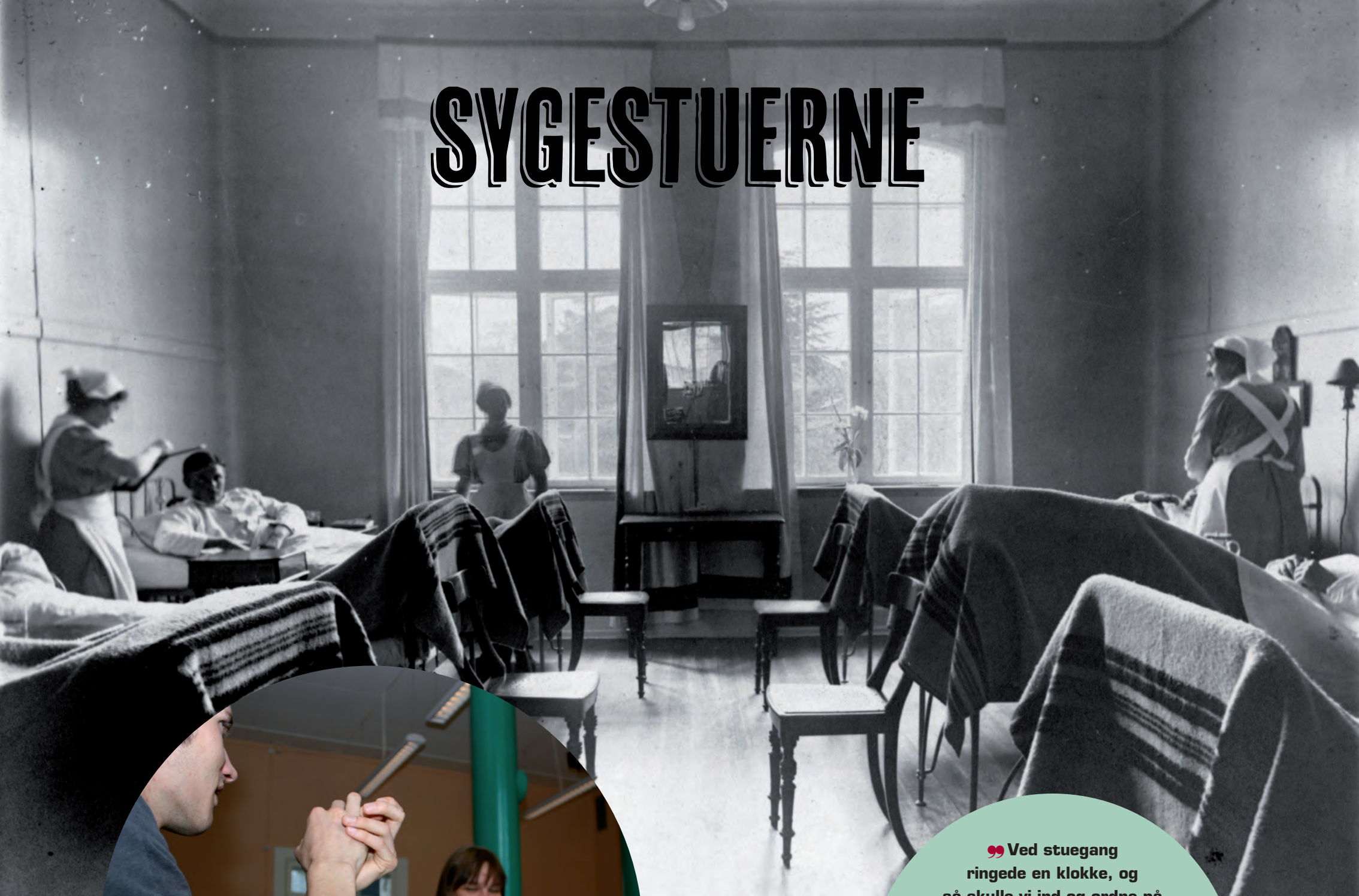
© SYGESTUE, 1930 © SYGESTUE, 1914