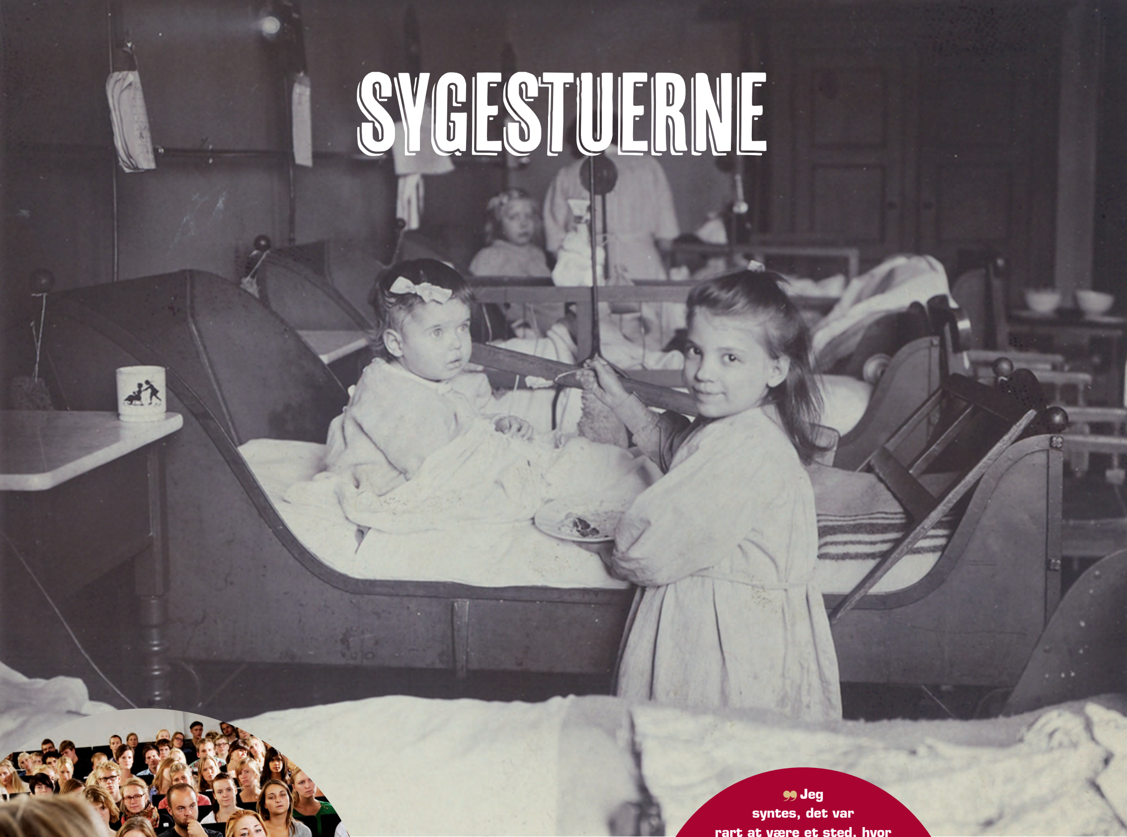
5. AFDELING, SOMMER 1905. 8. SENGSTUE, 1980-87