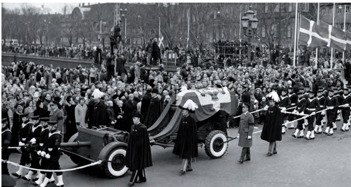
FREDERIK IX'S BEGRAVELSESTOG, 1972

Den 2. januar 1972 blev Frederik IX indlagt på Kommunehospitalets 2. afdeling. Kongen var blevet hasteindlagt efter at være blevet ramt af et hjerteanfald om morgenen. Kongens tilstand var kritisk ved indlæggelsen, men efter nogle dage kom der en vis forbedring i kongens tilstand. Der var fra hospitalets side lagt vægt på, at hospitalet skulle fungere som normalt, i det omfang det var muligt. Kongen var indlagt på enestue med almindelige patienter i stuen ved siden af. Der var hverken politi eller militær til stede på hospitalet, men man måtte sætte en fast portørvag foran kongens dør for at holde nysgerrige journalister ude. Forbedringen i kongens tilstand blev dog kortvarig og den 15. januar 1972 kl. 22 sov Frederik IX ind med den kongelige familie samlet ved sit dødsleje.