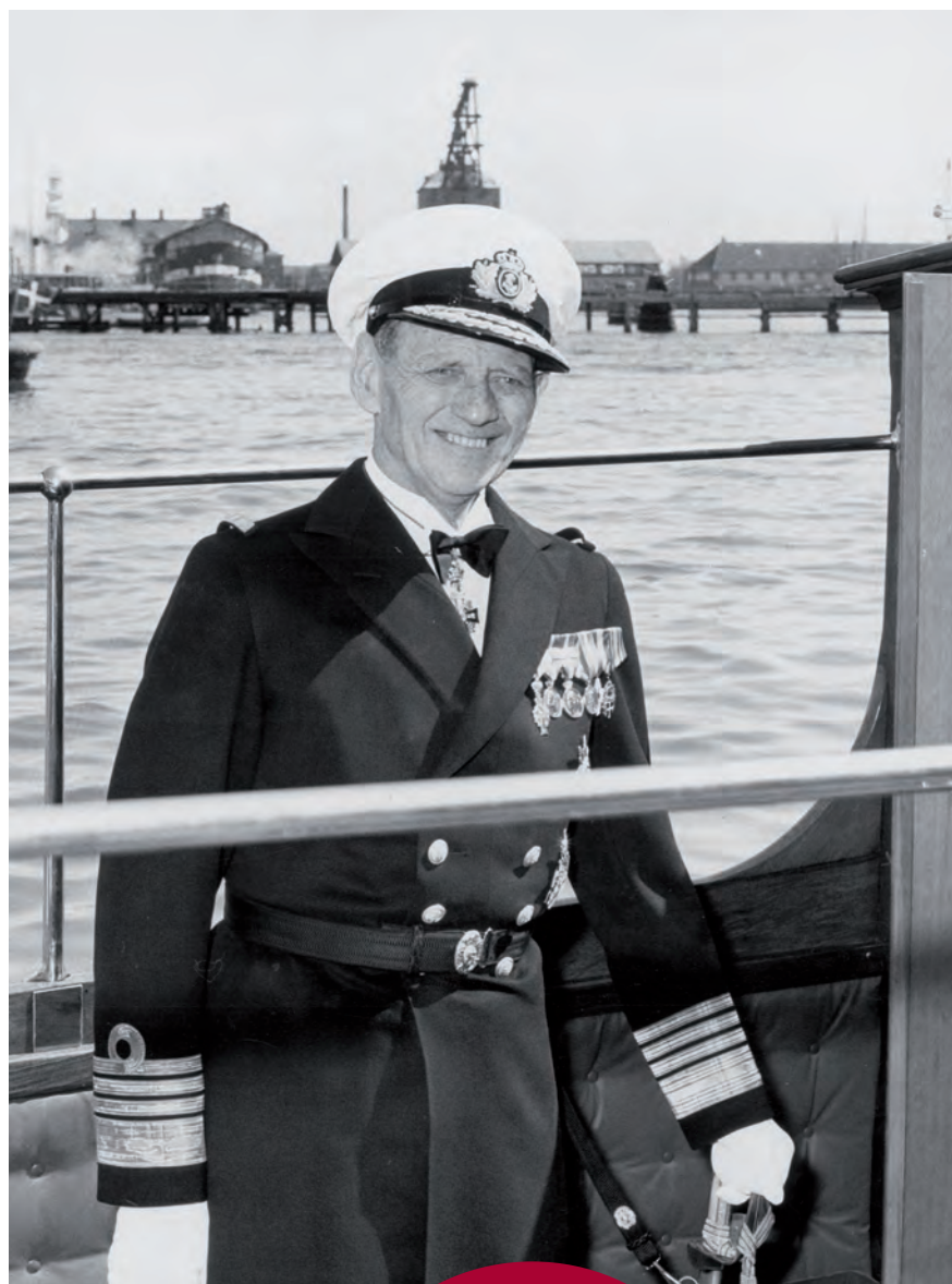
FREDERIK IX, 1968