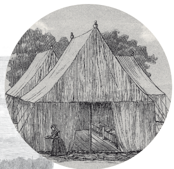
FRÅ KOLERALEJREN. SAMFEDIGS ILLUSTRATION