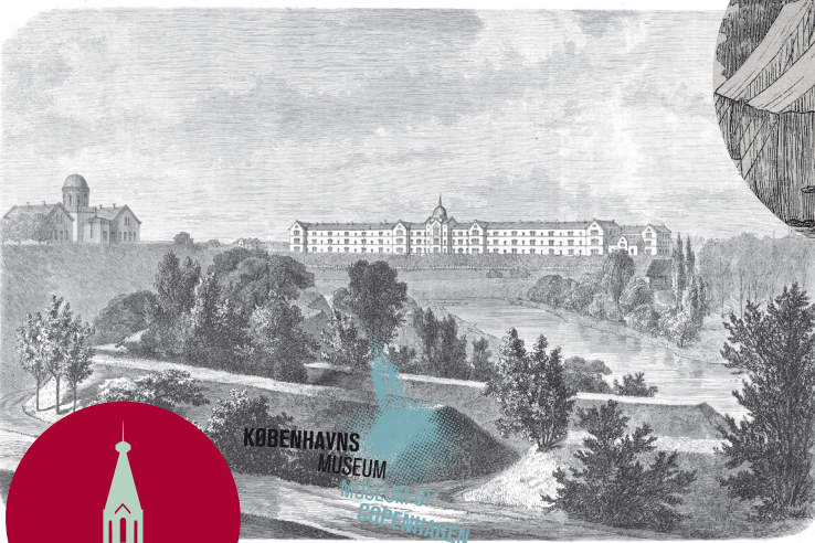
ILLUSTRATION AF KOMMUNEHOSPITALET 1855