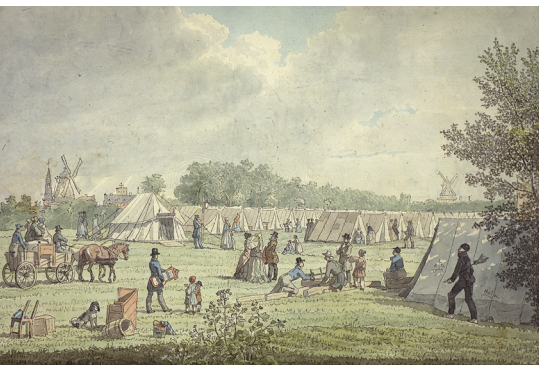
H. C. F. HOLM. KOLERALEJREN PÅ GLACÉEN 1853. LEJREN LÅ OMFRENT, HVOR KOMMUNEHOSPITALET BLEV OPFØRT