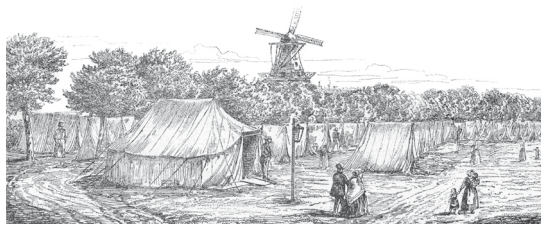
FRÅ KOLERALEJREN. SAMFEDIGS ILLUSTRATION

I 1855 besluttede man derfor at opføre et nyt og moderne hospital uden for voldene. Planerne om Kommunehospitalet blev således født ud af koleraepidemien.