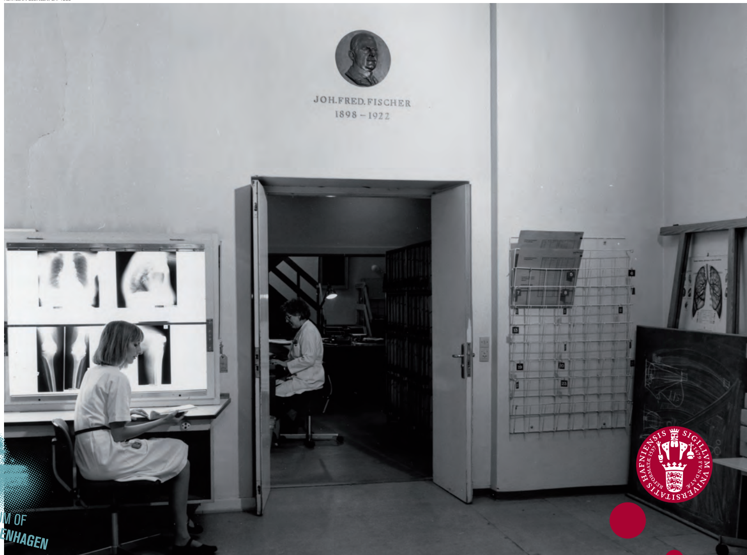
RØNTGENAFDELINGEN, CA. 1985

Kommunehospitalets røntgenafdeling fungerede frem til sygehusomlægningen i 1988.